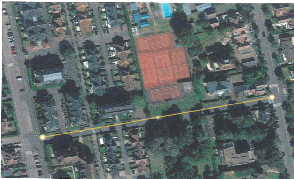
avenue des Diablotins